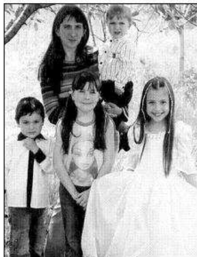
Elsőáldozás után - édesanya gyermekeivel