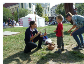
A nővéreközösség tagjai

Rendkívüli alkalom volt ez, amikor mi szerzetesek megéltük az egymás közötti egységet: különféle helyeken és módokon, más-más habitusban és karizmával, de ugyanabból a Lélekből merítve élünk.