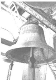
Meghallani, megszólítani, meghívni.